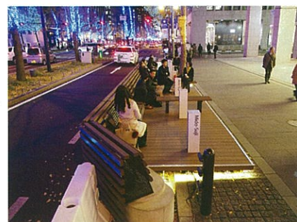
(写真)2017年 淀屋橋odona前での社会実験