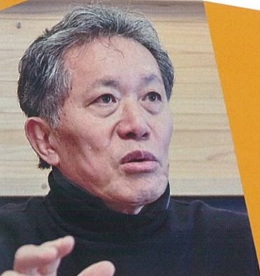
うちだ たつる 内田 樹氏

「入学式」「卒業式」「成人式」「結婚式」「お葬式」…。 私たちは、日常でさまざまな儀式・儀礼に接しています。 でも、それを単なる通過点として 見過ごしてきたのではないのでしょうか。 こうした儀式・儀礼そのもの、そしてその空間の 必要性やはたらきについて再考してみたいと思います。