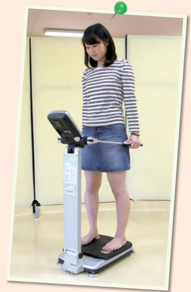
※体組成計による測定は 18:10 から実施します。

※体組成計では、我々の体を構成している体成分が均衡的なのか、体脂肪が多い部位はどこなのかなどを一目で分かりやすく見ることができます。 ※生活習慣記録機では、身体活動の強さを測定し、消費エネルギーを計算します。また、1日の運動の強さをグラフにすることにより、生活リズムがわかります。