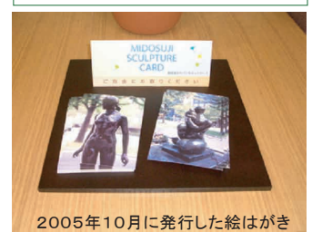
2005年10月に発行した絵はがき