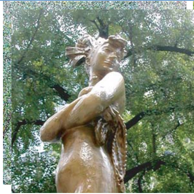
「ダンサー」 ヴェナンツォ・クロチェッティ 大阪東銀ビル前