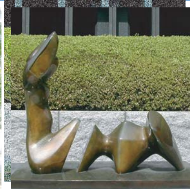
「二つに分断された人体」 ヘンリー・ムーア 伊藤忠ビル前