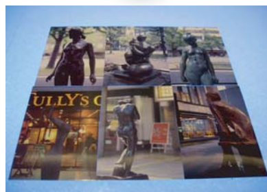
現在発行している絵はがき