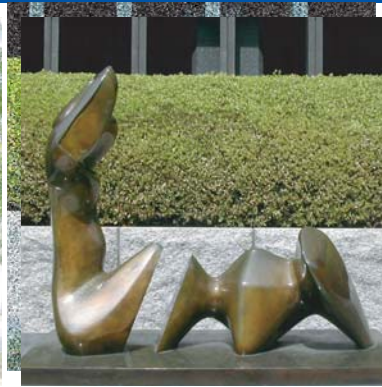
「二つに分断された人体」 ヘンリー・ムーア 伊藤忠ビル前