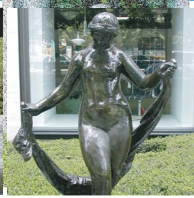
「ヴェールを持つヴィーナス」 オーギュスト・ルノワール 鴻池ビル前