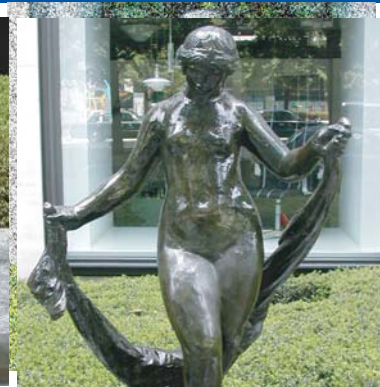
「ヴェールを持つヴィーナス」 オーギュスト・ルノワール 鴻池ビル前