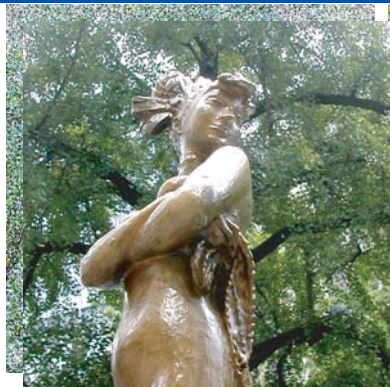
「ダンサー」 ヴェナンツォ・クロチェッティ 大阪東銀ビル前